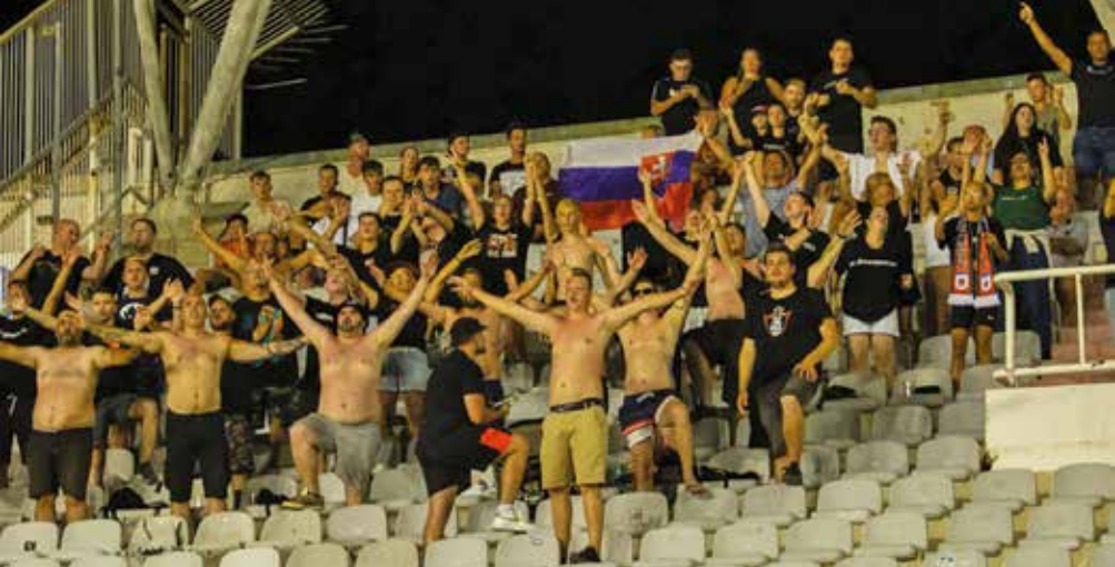
Fanúšikovia, ktorí nás prišli podporiť do Splitu.